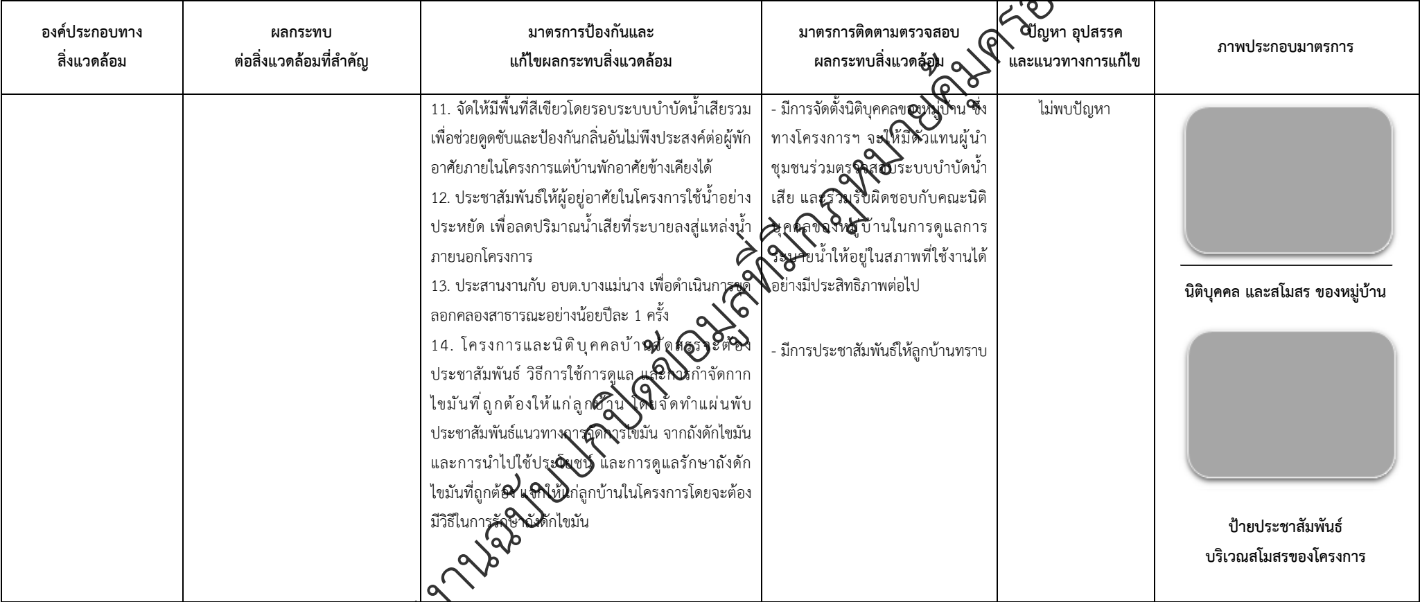
ตารางที่ 2-1 สรุปผลกระทบสิ่งแวดล้อมที่สำคัญและการปฏิบัติตามมาตรการป้องกันและแก้ไขผลกระทบสิ่งแวดล้อมและมาตรการติดตามตรวจสอบผลกระทบสิ่งแวดล้อม (ระยะดำเนินการ) โครงการจัดสรรที่ดิน เพอร์เฟค พาร์ค พระราม 5 - บางใหญ่ (โครงการต่อเนื่องในอนาคต) ตั้งอยู่ที่ ตำบลบางแม่นาง อำเภอบางใหญ่ จังหวัดนนทบุรี (ต่อ)