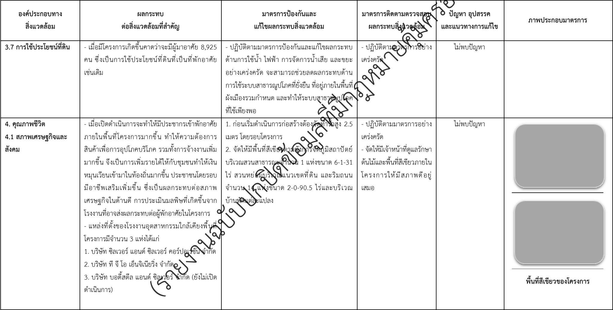
ตารางที่ 2-1 สรุปผลกระทบสิ่งแวดล้อมที่สำคัญและการปฏิบัติตามมาตรการป้องกันและแก้ไขผลกระทบสิ่งแวดล้อมและมาตรการติดตามตรวจสอบผลกระทบสิ่งแวดล้อม (ระยะดำเนินการ) โครงการจัดสรรที่ดิน เพอร์เฟค พาร์ค พระราม 5 - บางใหญ่ (โครงการต่อเนื่องในอนาคต) ตั้งอยู่ที่ ตำบลบางแม่นาง อำเภอบางใหญ่ จังหวัดนนทบุรี (ต่อ)