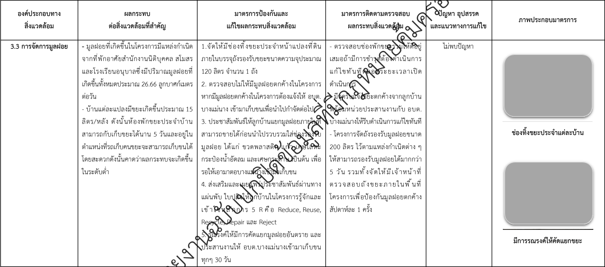
ตารางที่ 2-1 สรุปผลกระทบสิ่งแวดล้อมที่สำคัญและการปฏิบัติตามมาตรการป้องกันและแก้ไขผลกระทบสิ่งแวดล้อมและมาตรการติดตามตรวจสอบผลกระทบสิ่งแวดล้อม (ระยะดำเนินการ) โครงการจัดสรรที่ดิน เพอร์เฟค พาร์ค พระราม 5 - บางใหญ่ (โครงการต่อเนื่องในอนาคต) ตั้งอยู่ที่ ตำบลบางแม่นาง อำเภอบางใหญ่ จังหวัดนนทบุรี (ต่อ)