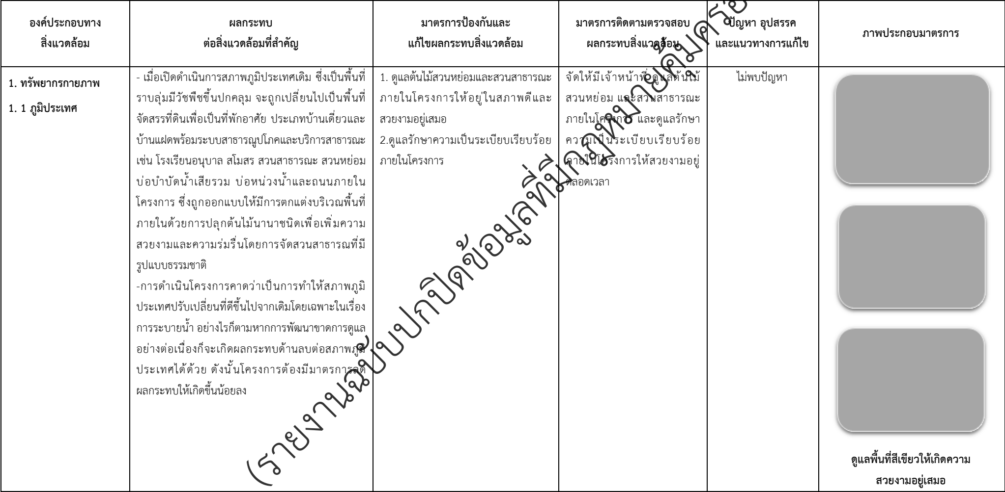
ตารางที่ 2-1 สรุปผลกระทบสิ่งแวดล้อมที่สำคัญและการปฏิบัติตามมาตรการป้องกันและแก้ไขผลกระทบสิ่งแวดล้อมและมาตรการติดตามตรวจสอบผลกระทบสิ่งแวดล้อม (ระยะดำเนินการ) โครงการจัดสรรที่ดิน เพอร์เฟค พาร์ค พระราม 5 - บางใหญ่ (โครงการต่อเนื่องในอนาคต) ตั้งอยู่ที่ ตำบลบางแม่นาง อำเภอบางใหญ่ จังหวัดนนทบุรี