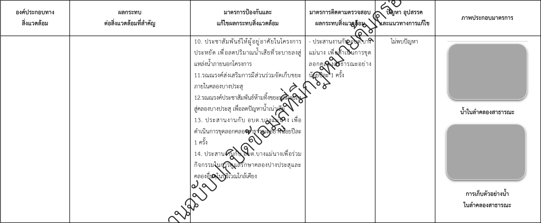
ตารางที่ 2-1 สรุปผลกระทบสิ่งแวดล้อมที่สำคัญและการปฏิบัติตามมาตรการป้องกันและแก้ไขผลกระทบสิ่งแวดล้อมและมาตรการติดตามตรวจสอบผลกระทบสิ่งแวดล้อม (ระยะดำเนินการ) โครงการจัดสรรที่ดิน เพอร์เฟค พาร์ค พระราม 5 - บางใหญ่ (โครงการต่อเนื่องในอนาคต) ตั้งอยู่ที่ ตำบลบางแม่นาง อำเภอบางใหญ่ จังหวัดนนทบุรี (ต่อ)